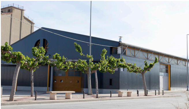
Remodelación Pabellón Multiusos