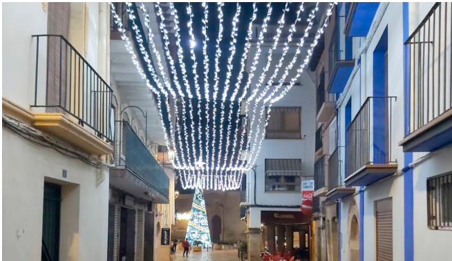
Iluminación calles Navidad