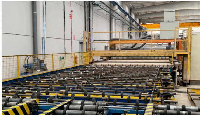
Nueva Línea de producción SEVASA