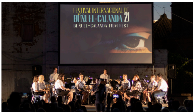
Festival Internacional de Cine en el Castillo