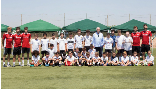
Academy Football Vicente del Bosque