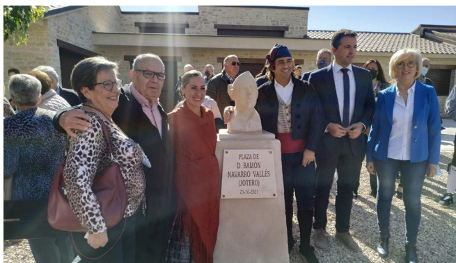
Nueva Plaza Ramon Navarro