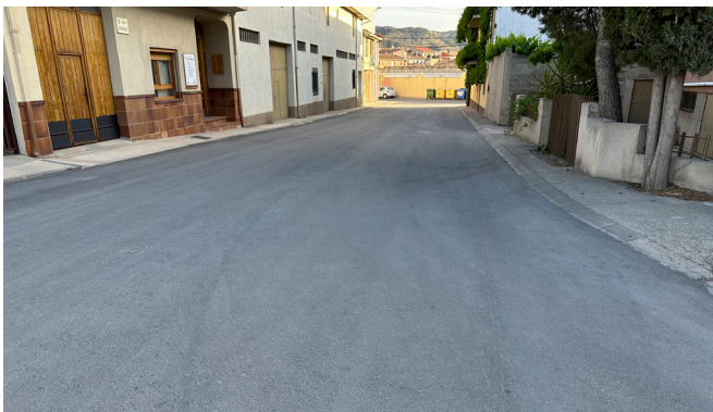
Adecuación calle Fontanales