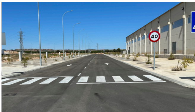
Nuevo Vial Pol. Cueva San José