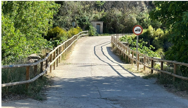
Barandilla Río Guadalopillo