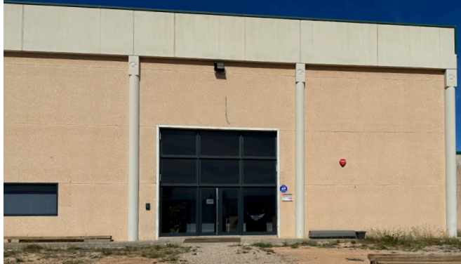
Magma, Nueva empresa de Fibra de Carbono