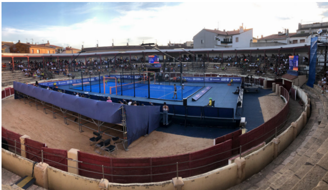
World Padel Tour