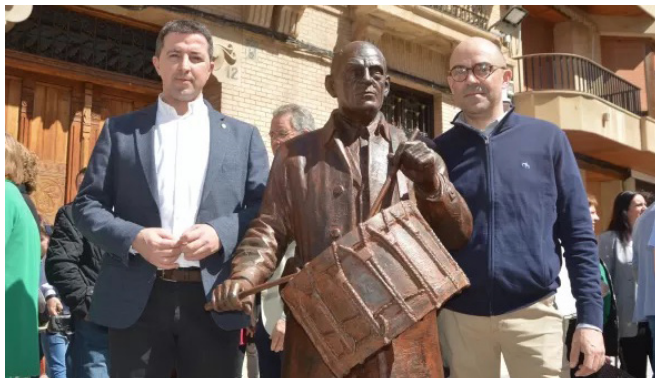
Escultura Luis Buñuel