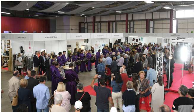
Feria de San Miguel