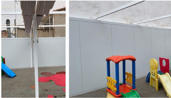
Adecuacion patio Guardería