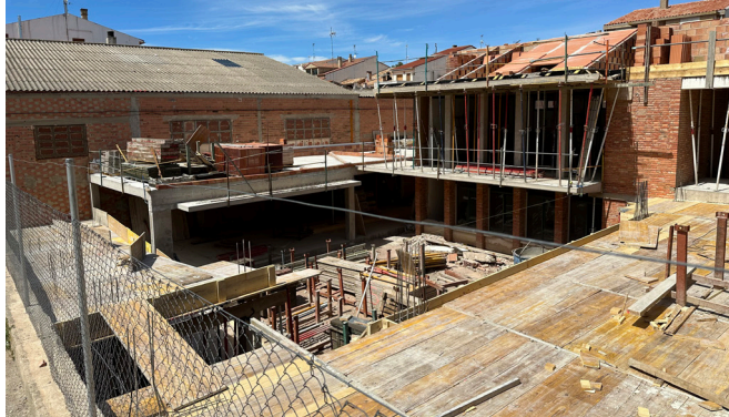
Ejecución Centro Educación Infantil