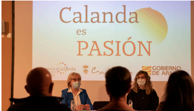
Actividades de desarrollo turístico