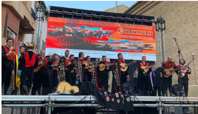
Certamen Nacional Tunas