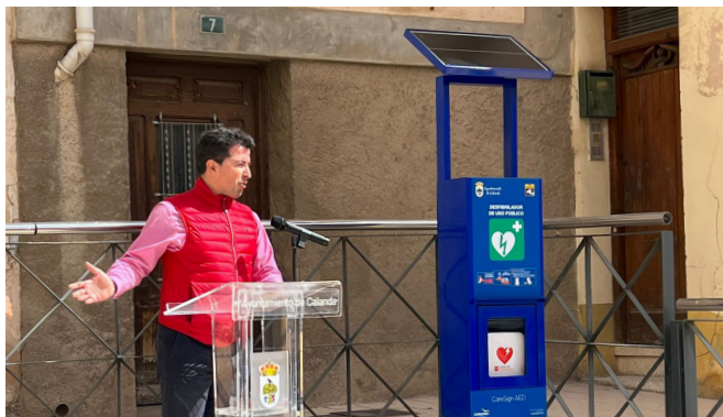
Instalación de Desfibrilador en vía pública